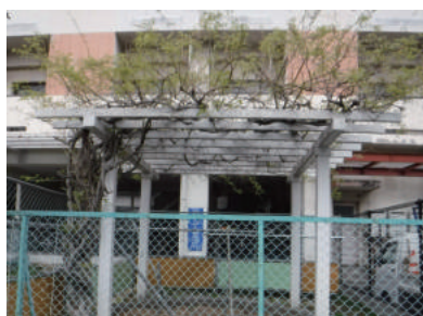
↑ 太い蔓の藤の木が 無造作に伸びていました

パーゴラとは、つる性の植物を絡ませるための木材などで組んだ棚のことで、日陰棚とも呼ばれています。こちらの団地では、ツル科の藤の木を使用していました。