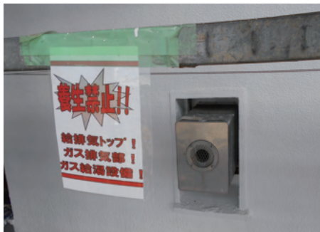
*自然給排気式の給排気を採用したガス風呂釜のこと

今回は複数棟ある集合住宅を検査しました。建物の形状によっては、外壁面に浴室の*バランス釜の吹き出し口があります。過去に外壁の塗装をする際、バランス釜本体を汚さないよう吹き出し口も一緒に養生してしまい、不完全燃焼による事故がありました。