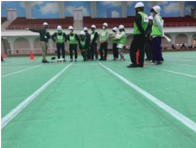
↑ 日本工学院大学蒲田校 片柳アリーナ

日本工学院大学蒲田校にて、学生に向けたドローン体験授業が行われました。そこで、建築ドローン安全教育講習を受けたリノ・ハピア社員が、授業を行うドローンチームのサポートをすることになりました。体験授業では、ドローンの操作方法を学んだり、実際に外壁近くに飛ばしてモニターチェックなどを行いました。