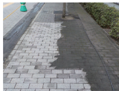
←後 高圧洗浄 前→

高圧洗浄で歩道をきれいにし、明るく遊び心のある照明を設置することで暗いイメージが一新されました！ (多摩支店)