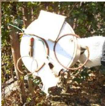
すると… 番線以外の鉄くずも しっかりキャッチ!