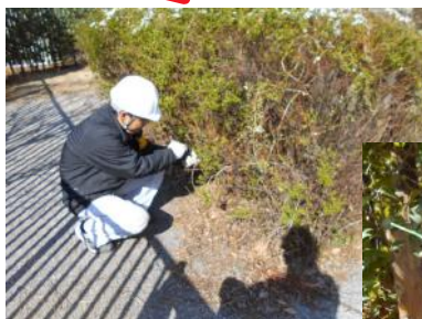
植え込みの中へ差し込み カサカサします

修繕工事終了後は、足場の部材同士を結束していた針金(II番線)などが解体の際に散乱して、芝生や植え込みに埋もれてしまい、目視での回収が難しくなることがあります。そこで、この現場で取り入れられた方法は、マグネットを活用した回収でした。この方法であれば、植え込みの中に潜り込んでしまった番線も、磁石の力で回収することが出来ます。また、工事が出たゴミ以外の鉄くずも拾うことが出来、一石二鳥でした。